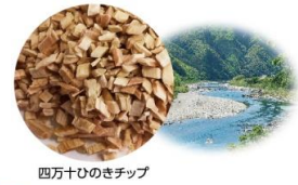
四万十ひのきチップ